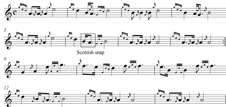
<악보 1> 스코틀랜드 전통 피브록(Pibroch) 25)

<악보 1>은 주제에 대한 변주의 일부분으로 장식음들을 제외한 정상 음표의 선율을 이어나가면 주제선율을 찾을 수 있다. 으뜸음 A로 시작하는 주제선율은 전형적인 온음구성의 5음음계로 씌여진 8마디 구성의 한 악절을 이루고 있으며, 두 번째 악절(마디 9)에 이르러 으뜸음이 G로 이동하면서 6음음계로 변화하였고, 마디수도 6마디로 축소되었다. 으뜸음의 위치가 A에서 G로 변화한 후에 다시 원래의 으뜸음인 A음으로 돌아와 하나의 변주가 끝을 맺는 ‘이중 으뜸음’의 조성구조를 보인다. 다양한 선법의 쓰임이 강조되었던 스코틀랜드 전통음악에서는 선법에 대한 다양한 작법들이 나타나며, ‘이중 으뜸음’과 같이 특징적으로 여겨지는 작법으로서 ‘이중 선법(dual modality)’을 뽑을 수 있다. ‘이중 선법’이란 곡을 시작할 때의 선법과 마칠 때의 선법이 다른 경우를 뜻한다(악보 2). 로우랜드 지역의 민속음악에서 주로 쓰이던 ‘이중 선법’은 피브록과 게일어의 노래(Gaelic song)에서도 자주 사용되었고, 결국엔 전 지역으로 전해지면서 스코틀랜드 민속음악의 전형적인 특징으로 여겨지게 되었다. <악보 2>는 스코틀랜드의 유명한 민속노래 중 하나이다. 이 선율은 Eb을 근음으로 하는 교회선법의 이오니아(Ionia)로 시작하여 C음을 근음으로 하는 에올리아(Aeolia)로 옮겨진 후 끝을 맺는 ‘이중 선법’의 형태를 명확히 보여준다.