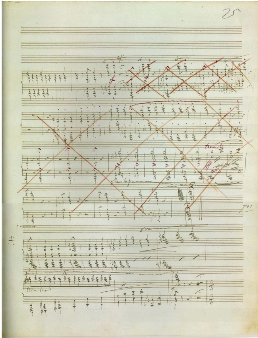
<예 12> 리스트의 천필 악보: 십자가 모티브 마지막 진술의 종결 부분 28)

실은 현실이 아닌 것이거나(꿈이나 환상), 혹은 승리에 대한 정신적 승화(sublime)를 표현한 것이라는 두 개의 다른 해석으로 이어질 수 있을 것이다. 본 연구는 이 두 개의 해석 중 후자가 더 타당하다고 주장 하는데, 이는 마지막 십자가 모티브의 진술 뒤에 이어 나오는 안단테 소스테누토의 주제적-표현적 제스처에 근거를 둔다.