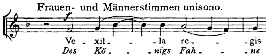
〈예 1〉 《십자가의 길》, 7-9마디 성악 성부 4)

루어진 모티브는 리스트의 오라토리오 《성녀 엘리사벳》( Saint Elisabeth , 1862)과 같은 종교 작품 뿐만 아니라, 피아노 솔로를 위한 《한숨》( Un Sospiro , 1845-1849), 피아노 소나타 B단조 ( Sonata in B minor , 1853), 교향시 11번 《훈족의 전투》( Hunnenschlacht , 1857) 등의 세속적 작품에서도 자주 나타난다. 이 모티브는 본래 (예2)의 그레고리안 성가 《신앙의 십자가》( Crux Fidelis )에서 유래한 것으로 장2도 순차 상행이 단3도 상행으로 이어지는 선율적 제스처로 설명될 수 있으며, 유래한 그레고리안 성가의 표제를 따서 ‘십자가 모티브’라고 불린다. 3) 리스트의 작품에서 십자가 모티브는 주로 3도 하행 관계로 화성화 되며, 리스트의 신앙심이 반영된 부분이라 할 수 있기 때문에 기독교에서의 구원(救援)을 의미하는 맥락으로 주로 사용되었다. 십자가 모티브는 리스트의 B단조 소나타의 2주제에서 현저하게 등장하는데, 본 논문은 800마디에 육박하는 대규모의 단악장 소나타에서 십자가 모티브가 주제적으로 변형되는 과정을 추적하고, 주제적 변형이 동반하는 표현적 변형의 과정을 내러티브적으로 해석하고자 한다. 따라서 본 논문이 제시하는 내러티브적 분석은 십자가 모티브의 형태의 변화뿐만 아니라 ‘표현성’(expressivity)의 변형에 초점을 맞출 것이고, 주제적 성격과 정서 구조의 변화에 근거하여 십자가 모티브가 만들어내는 이야기를 제시하는 것에 본 논문의 목적이 있다.