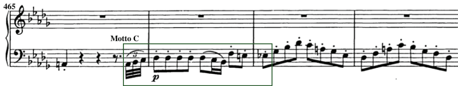
<예 5> 푸가토에서의 모토 C

모토 D는 상행하는 세 음의 조합으로 이루어지는 십자가 모티브를 기초로 하며, 제시부의 2주제 영역인 마디 115의 그란디오소(Grandioso)에서 처음으로 제시된다. 십자가 모티브는 (예 6)과 같이 장2도-단3도 조합의 선율 조각이 두 번 등장하며 선율을 이루어내고, 장대한 다이내믹과 3도 관계의 화성진행이 동반된다. 경과부에서 길게 나타나는 D장조의 딸림화음의 연장은 2주제에서 D장조의 으뜸화음으로의 도착을 더욱 극적으로 만들고, 십자가 모티브 선율과 넓은 음역을 어우르며 가득 채우는 화음 반주는 종교적 승리를 환기시킨다. 종교적 장엄함과 승리를 상징하는 2주제는 어두운 폭풍 같은 1주제의 성격과 확연한 대조를 이루는데, 이는 1주제와 2주제의 대조성을 선-악의 이항대립(binary opposition)으로 해석했던 학자들의 주장에 대한 근거가 된다. 23)