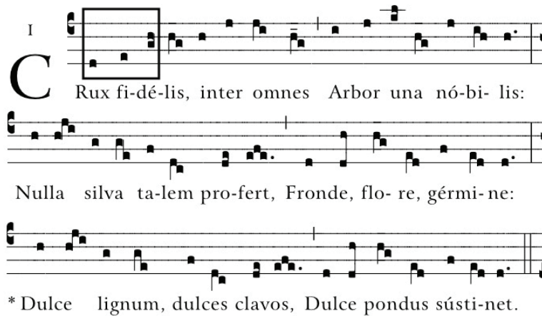
<예 2> 그레고리안 성가 《신앙의 십자가》(Cruce Fidelis) 5)